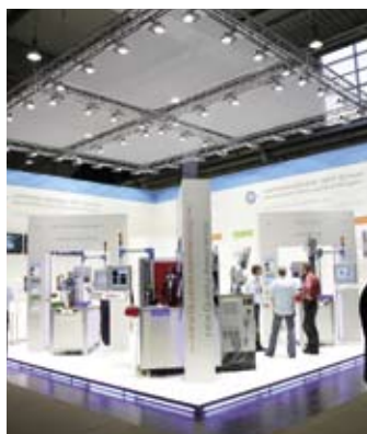
Der HWH-QST Messestand

In Halle 14 leuchtete ein Stand und vor allem seine Produkte über alles hinaus. Die Rede ist natürlich vom Stand der HWH QST GmbH (QS-Technologie). In dem als QS-Workshop konzipierten Messeauftritt mit praktischen Anwendungszellen zum Widerstandspunktschweißen, zum Widerstandsbuckelschweißen, zum Schutzgasschweißen