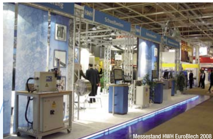
Messestand HWH EuroBlech 2008

nur um beispielsweise Steuerteile (Retooling-Lösungen) voll genutzt werden. Ein Beispiel dazu ist die Aufrüstbarkeit vorhandener Inverter auf die Genius-Funktionalität mit Regelung oder integrierter Prozessüberwachung PQS (System GeniusHWI). Ein weiteres Beispiel für Kostenreduzierungen durch HWH-Steuerungen ist das Schrankkonzept mit der RatialE. Bei dieser Steuerung ist das Leistungsteil integriert und es können in vorhandene Schaltschränke (z. B. VW S80 System) mehr Schweißsysteme ein-