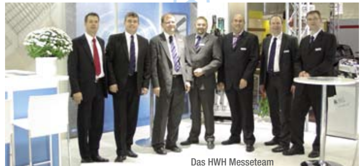
Das HWH Messeteam

Systeme zu beleuchten. Zum einen bringen da die Mittelfrequenzsysteme mit oder ohne adaptiver Regelung IQR großen Nutzen im Bereich Energieeinsparung und Prozessstabilisierung. Fortsetzung auf Seite 2