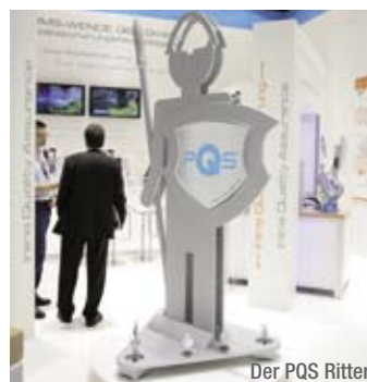
Der PQS Ritter

mum reduziert werden. Die Investition zur PQS-Überwachung rechnet sich in kürzester Zeit. Beispielrechnungen dazu konnten den Anwendern gezeigt und überreicht werden. Das Besondere an der Überwachungsphilosophie ist die Bandbreite an zu überwachenden Verfahren, wie sie auch auf dem Messestand gezeigt werden konnte. Der Nutzer kann zur Überwachung eines Bauteiles komplett auf eine Überwachungs- und Absicherungsstrategie setzen, der PQS-Überwachung. Mehr dazu erfahren Sie für den Bereich Widerstandsschweißen bei Ihrem Harms & Wende-Partner, im Bereich andere Fügetechnologien bei der HWH-QST auf www.hwh-qst.de oder Ihrem QST-Ansprechpartner.