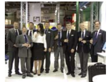
Das HWH Messeteam

Neben den Harms & Wende-Widerstandsschweißlösungen waren die mögliche Integration der echten Prozessüberwachung PQS unserer Tochterfirma HWH-QST in das System Genius und die Reibpunktschweißanlage RPS im Fokus der Besucher. Die Integration der PQS-Überwachung im Genius-Inverter bringt den Anwendern große Kosteneinsparungen sowohl beim Invest als auch im laufenden Betrieb durch die lückenlose Inlineüberwachung. Das Reibpunktschweißen RPS ermöglicht das Verbinden von Aluminiumwerkstücken ohne Zusatzmaterial und birgt damit ein enormes Einsparpotenzial bei den Kunden. Die sehr konkreten Besprechungen mit Anwendern aus der Automobilindustrie