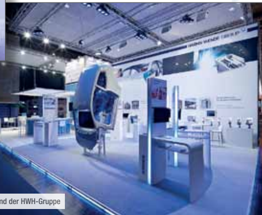
Messestand der HWH-Gruppe

und Schutzgasschweißverfahren von unserem Tochterunternehmen HWH-QST GmbH. Eine weitere Station zeigte die Automatisierungslösungen um das Schweißsystem Sinius und um das technische Wärmen. Diese Station der Marke Procon PAS präsentierte die Nutzen für die Automatisierung von Prozessen. Unsere Inverter der Serie Genius mit adaptiver Regelung IQR und die bedienerfreundliche und innovative Oberfläche XPegasus 3.0 für automa-